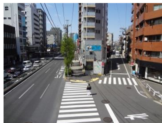
写真20 右側の道路がかつての目黒通りで、左側の道路はなかった