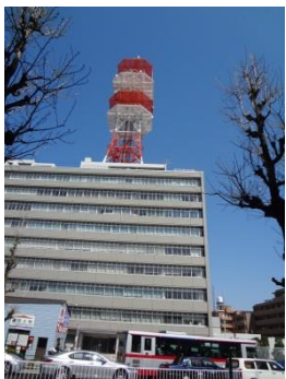
写真8-1 北里柴三郎の研究所跡地に立つNTT唐ヶ崎ビル

再び目黒通りに戻り、南西に進み目黒郵便局の交差点まで来ると、それまで遠方に見えていたタワーが、右手前方の目の前にあるNTT唐ヶ崎ビル（唐ヶ崎とはこのビルのある地域の旧町名です）の上に建つタワーとして見る事ができます（写真8-1・2）。広い範囲に渡ってこのタワーを見ることが出来ることから、地元では目黒タワーと呼んで地域の目印代わりに使われていますが、かつてはこのビルのところに北里柴三郎の研究所がありました。今はその当時の面影は全くありません。このビルを見てしばらく進むと前方にスーパーのダイエーが見えてきます。そのダイエーのある交差点の