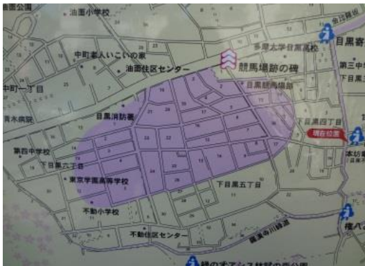
写真7-1 旧東京競馬場の跡を示す図（目黒区の案内板より）

明が書かれています。この像も昭和58年に設置されたもので、それ以前はなぜここに「元競馬場前」という名称のバス停があるのかわからない人も多かったと聞いています。地図でこの付近を見るとバス停の南側に大きくカーブした道が発見できます。この道こそが、かつてここにあった目黒競馬場のコース（写真7-1）で、第3コーナーから第4コーナーのカーブ（写真7-2・3）を曲がって約300mの直線コースの部分が残っています。自転車に乗りながら当時の競馬場を走っている気持ちになるのもよいのではないのでしょうか。