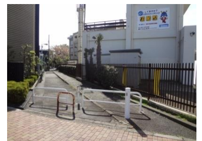
写真9 暗渠化されて遊歩道化した立会川。右側の建物が目黒消防署碑文谷出張所

立会川の主となる源流は2箇所あります。碑文谷公園内にある弁天池（写真10）と清水公園内にある清水池です。碑文谷公園の入り口は何カ所もあり、