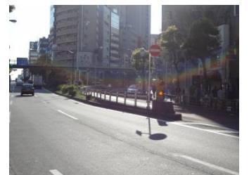
写真2 左側の直線化された道路が後から作られた目黒通り

自転車で出発してすぐに山手線を越えると、権之助坂を下り始めます。その坂の途中で右側からくるもう1本の目黒通りと一緒にになります(写真2)。現在、目黒通りは自然教育園の前からこの権之助坂の途中までそれぞれ一方通行化された2本の通りになっていますが、都心に向かう方向の通りは後から造られたもので、直線化されています。