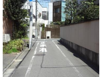
写真14 立会川のもう一つの源流地 道路の右端に流れがあった

この立会川の源流は弁天池と清水池の他にもあります。碑文谷八幡宮入り口付近からの流れがあります。また、目黒通りの目黒消防署碑文谷出張所の右側で弁天池からの本流と合流している流れもあります。鷹番1丁目15番あたり（写真14）にある湧水からの流れです。住宅地のどこにでもある生活道路の横に、かつては立会川としての水の流れを目にすることができたのです。