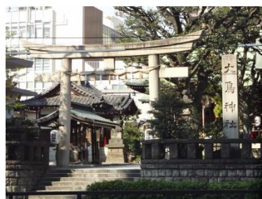
写真4 山手通りとの交差点脇にある大鳥神社