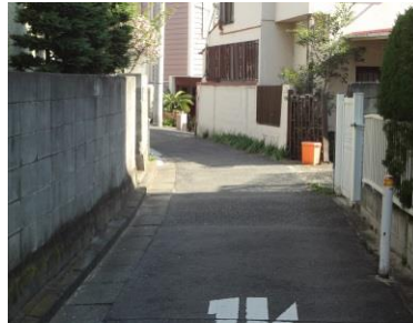
写真7-2 第4コーナー付近の道路