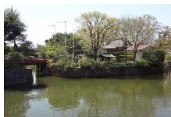
写真11 弁天池内の島に建っている巖島神社

に乗って楽しむのもよいし、近くの老舗のケーキ屋さん（写真12）で一休みするのもよいのではないのでしょうか。ここから立会川に沿って走るには地図（図1参照）が必要です。碑文谷八幡宮から目黒線西小山駅の先までは暗渠化したところが道路から一段高くなった桜並木の遊歩道になっています（写真13）ので、すぐにわかります。