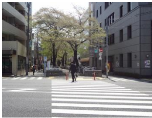
写真21 暗渠化されて遊歩道化した呑川

因みにG I A N Tの店の前の東横線の脇にかつて大きなビルのボーリング場がありました。そういえばダイエー本館前にもダイエーサイクル館がありますが、