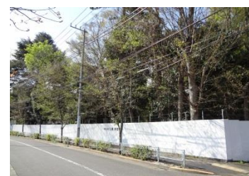
写真18 武蔵野の自然が残っているが、現在は企業の管理地になっている

この公園は昭和56年開園と比較的新しいにも関わらず、公園の中には竹林が残っています。それもそのはずで、かつてここに住んでいた女性が亡くなり、親族がいなかったため、国の所有となり、その後公園化されたことで、ここだけが昔の姿を残しているのです。もう一カ所、ダイエーからサレジオ教会へ向かう道の右側も昔のままの自然が残っています(写真18)が、この姿が消えてしまう可能性もあるのが心配です。