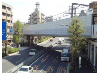
写真19 現在の目黒通りと東横線の位置関係。左端の建物の所にかつてボーリング場があった

す。そのまま呑川本流（写真21）を通過して、満願寺坂を上り進んで行くと多摩川に到着します。