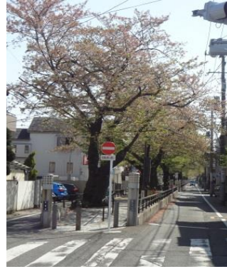
写真13 碑文谷八幡宮前から目黒線西小山駅の先まで続く遊歩道