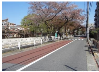
写真15-2 サレジオ教会の裏の道路の下に立会川の流れがある

立会川巡りの途中にはサレジオ教会(カトリック碑文谷教会)(写真15-1・2)や碑文谷八幡宮(写真16)などがありますが、いずれも昔の姿をそのまま残しています。またすすめのお宿緑地公園も昔のままです(写真17-1・2)。かつてこの