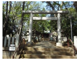
写真16 碑文谷八幡宮

の一角は竹林が広がり、多数のすすめが飛び交ったところからこの名が付いたのですが、その竹林も今は宅地に代わってしまいました。