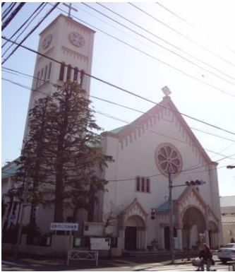
写真15-1 サレジオ教会

この立会川の源流は弁天池と清水池の他にもあります。碑文谷八幡宮入り口付近からの流れがあります。また、目黒通りの目黒消防署碑文谷出張所の右側で弁天池からの本流と合流している流れもあります。鷹番1丁目15番あたり（写真14）にある湧水からの流れです。住宅地のどこにでもある生活道路の横に、かつては立会川としての水の流れを目にすることができたのです。