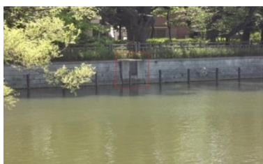
写真10 碑文谷公園内にある弁天池。赤枠内から立会川が始まる

いずれも駐輪場が用意されています。池の真ん中にある島には弁財天を祭った巖島神社があります（写真11）。何年か前に放火でお社を焼失してしまいましたが、現在は再建されています。池には貸しボートもありますので、これ