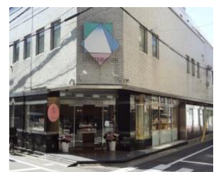
写真12 碑文谷公園近くにある創業62年の老舗ケーキ屋「マッターホーン」。奥には10人が座れるグループ席もある

に乗って楽しむのもよいし、近くの老舗のケーキ屋さん（写真12）で一休みするのもよいのではないのでしょうか。ここから立会川に沿って走るには地図（図1参照）が必要です。碑文谷八幡宮から目黒線西小山駅の先までは暗渠化したところが道路から一段高くなった桜並木の遊歩道になっています（写真13）ので、すぐにわかります。