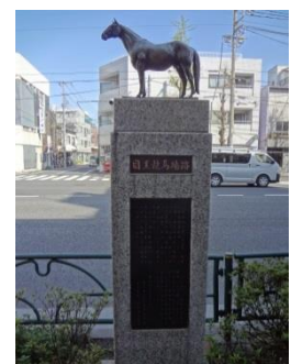
写真6 トウルヌソル号という馬の像

引き続いて金毘羅坂を上ると「元競馬場前」というバス停があり、すぐ近くにトウルヌソル号という馬の像が置かれ(写真6)、かつてこの地に競馬場があったという説明が書かれています。その説明によると、明治40年に旧東京競馬場がこの地に開設され、第1回のダービーが開催されました。像になっているトウルヌソル号という馬は、この第1回ダービーで優勝した馬の父馬だそうです。その後、昭和8年に府中にある現在の東京競馬場に移転したことからバス停名と、毎年5月に開催される目黒記念レースに旧東京競馬場を記念した名が残されています。今でこそ馬の像と競馬場があったという説