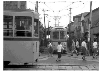
写真1 正面が都電の車庫で右側に現在のアトレ2がある

自転車文化センターがあるビルの前の通りにはかつて都電が走っていて、時には花電車なども運行されました。その都電の車庫が目黒線や地下鉄線の入り口横にありました(写真1)。ちょうど今、再開発のために建物の取り壊しが始まった所です。ここから出発した都電は自然教育園前を経由して清正公前交差点に向かって進んでいました。