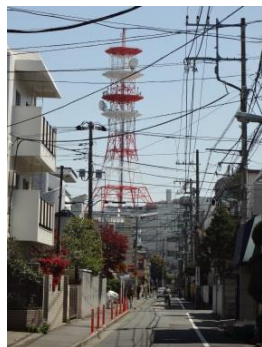
写真8-2 目黒タワーは広範囲から見る事ができる

直前の左側に目黒消防署碑文谷出張所がありますが、そのすぐ裏を今は暗渠化されてしまった立会川が流れています（写真9）。