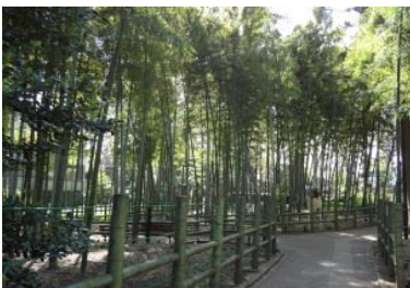
写真17-1 すずめのお宿緑地公園内の竹林

の一角は竹林が広がり、多数のすすめが飛び交ったところからこの名が付いたのですが、その竹林も今は宅地に代わってしまいました。