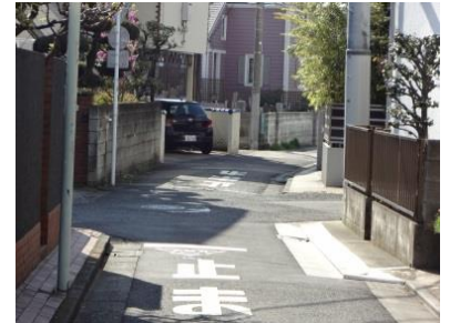
写真7-3 第3コーナー付近の道路。道幅が狭く、見通しも良くないので、自転車で通るときは注意が必要

再び目黒通りに戻り、南西に進み目黒郵便局の交差点まで来ると、それまで遠方に見えていたタワーが、右手前方の目の前にあるNTT唐ヶ崎ビル（唐ヶ崎とはこのビルのある地域の旧町名です）の上に建つタワーとして見る事ができます（写真8-1・2）。広い範囲に渡ってこのタワーを見ることが出来ることから、地元では目黒タワーと呼んで地域の目印代わりに使われていますが、かつてはこのビルのところに北里柴三郎の研究所がありました。今はその当時の面影は全くありません。このビルを見てしばらく進むと前方にスーパーのダイエーが見えてきます。そのダイエーのある交差点の