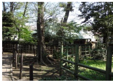
写真17-2 すずめのお宿緑地公園内にあるかつての土地所有者の住居

この公園は昭和56年開園と比較的新しいにも関わらず、公園の中には竹林が残っています。それもそのはずで、かつてここに住んでいた女性が亡くなり、親族がいなかったため、国の所有となり、その後公園化されたことで、ここだけが昔の姿を残しているのです。もう一カ所、ダイエーからサレジオ教会へ向かう道の右側も昔のままの自然が残っています(写真18)が、この姿が消えてしまう可能性もあるのが心配です。